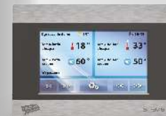
Sterownik Tech ST-976